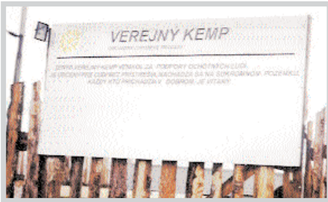
Táto tabuľa vás víta pri vstupe do Verejného kempu