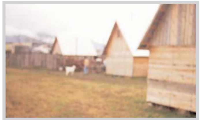
Takéto chtky pomáhajú bezdomovcom žiť ako ľudia