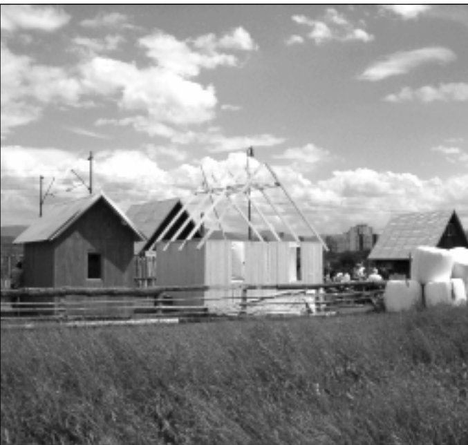
Výstavba nových chatiek v kempe pokračuje...