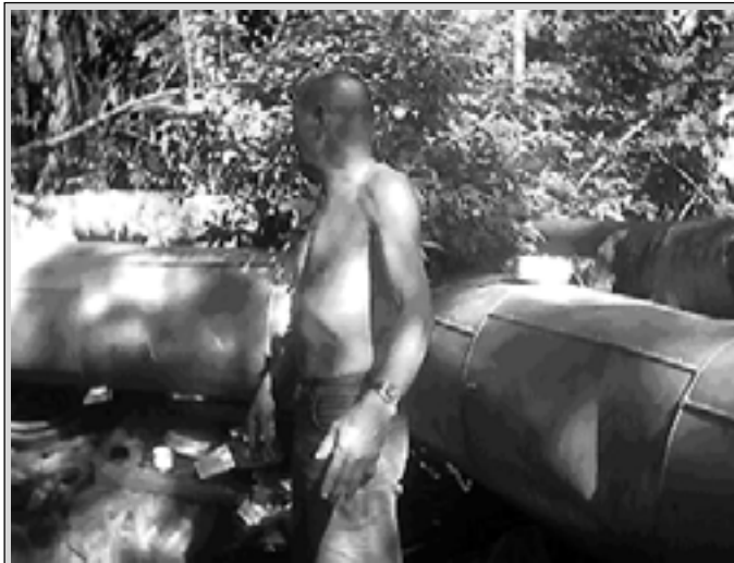
Odvrátená tvár spoločnosti

Odpoveď: - Viete, s takýmito zariadeniami je to veľmi ožehavá téma. Ako som už spomenul napr. naše jednoizbové bunky na Žilinskej ceste, myslím, je ich 24, viete, to všetko stojí nemalé finančné prostriedky. Tam je potrebné, aby to malo aspoň základné hygienické podmienky, aby tam bolo WC, voda, aby to malo posteľ atď., to sú obrovské náklady. Rozpočet mesta, ale