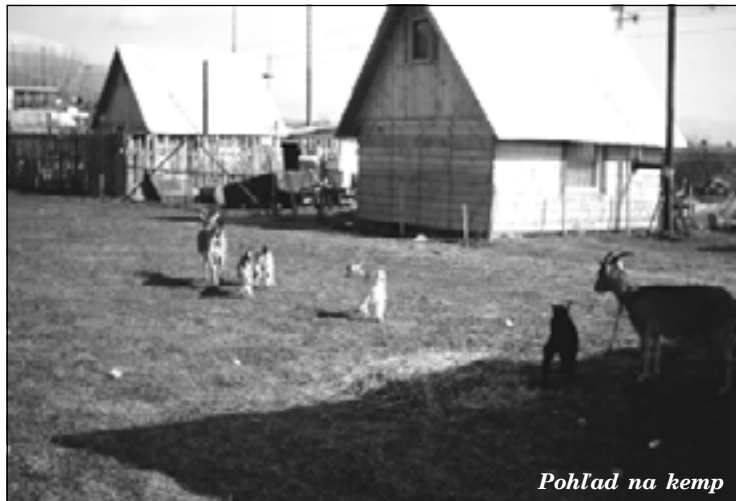
Pohľad na kemp