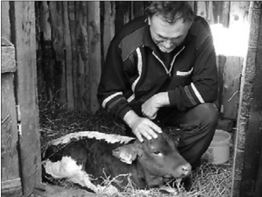
Slabé a choré teliatko určené na utratenie je ďalším obyvateľom kempu.

Ročník II. * číslo 14 - 2004 * cena 10 Sk - pri pouličnej distribúcii zdarma